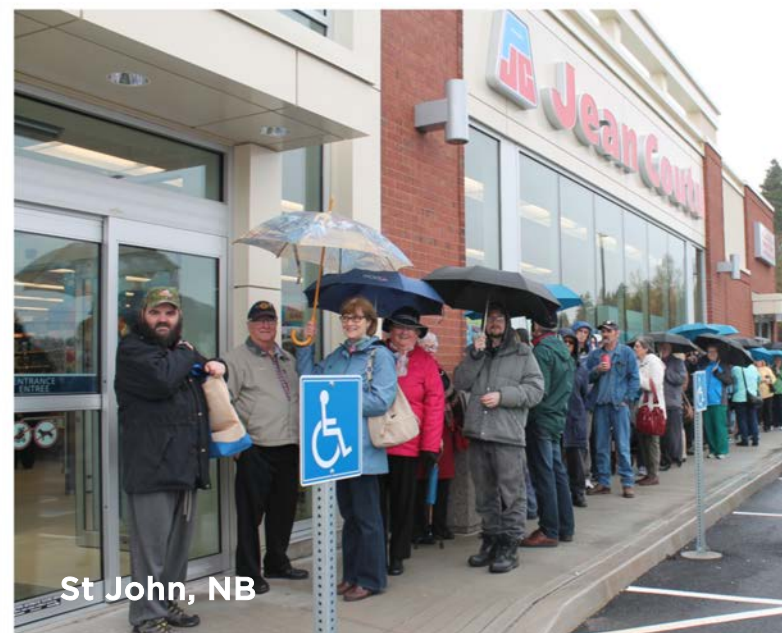
St John, NB