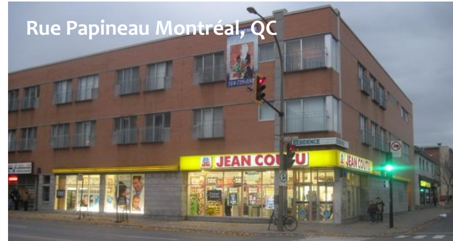
Rue Papineau Montréal, QC