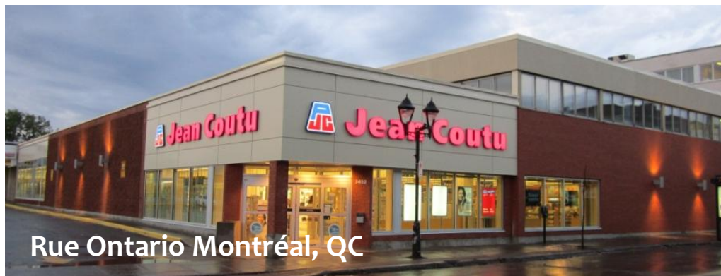
Rue Ontario Montréal, QC

8 projets de rénovation et d'agrandissement au cours du dernier trimestre