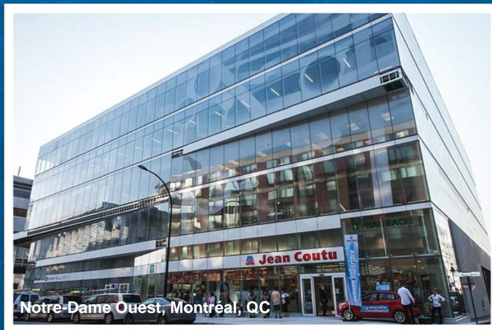
Notre-Dame Ouest, Montréal, QC

Ouverture de 3 nouvelles succursales, dont 1 relocalisation