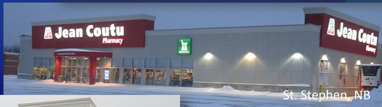
St. Stephen, NB